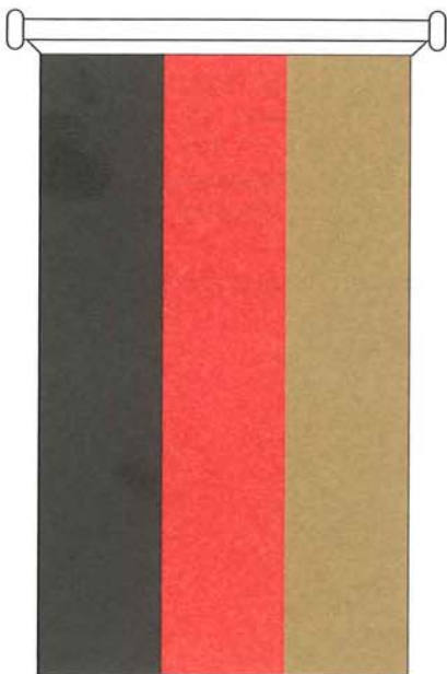
Bundesflagge in Bannerform