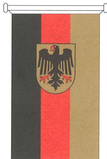
Bundesdienstflagge in Bannerform