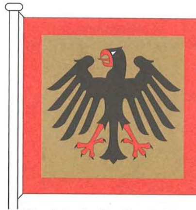
Standarte des Bundespräsidenten